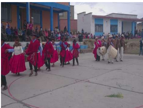
área de sus terrenos y de su comunidad

Después de conocer la parte teórica los estudiantes Valoran de manera óptima y eficientemente las composiciones musicales originarias de los géneros e instrumentales a partir de un análisis de la forma y estructura de cada una de ellas siempre cuidando los saberes y conocimientos ancestrales desde sus comunidades y regiones, las actividades sobre la utilidad de las funciones y su importancia de cada elemento, algunos estudiantes manifestaron que es muy importante en la vida conocer y aplicar estos conocimientos en nuestro entorno.