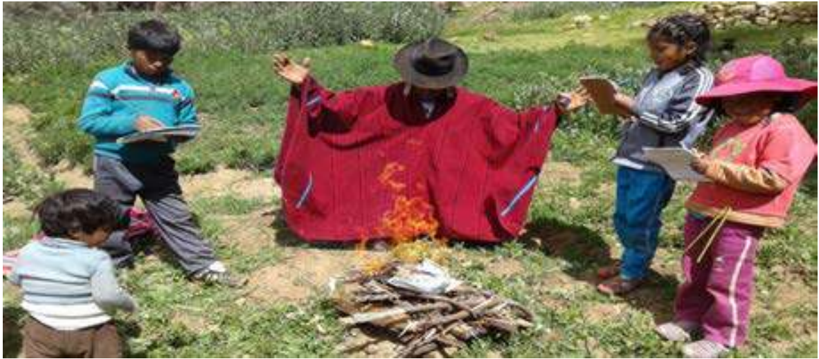
FOTO N° 1: Realizando waxt'a a nuestra PSP, juntamente con nuestros estudiantes.