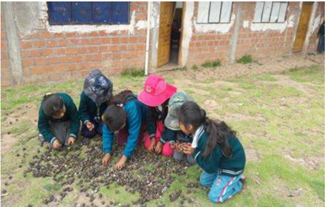
FOTO Nº 8: REALIZACION DEL CONTEO Y DESCONTEO CON LOS FRUTOS DE LA PLANTA DE PINO