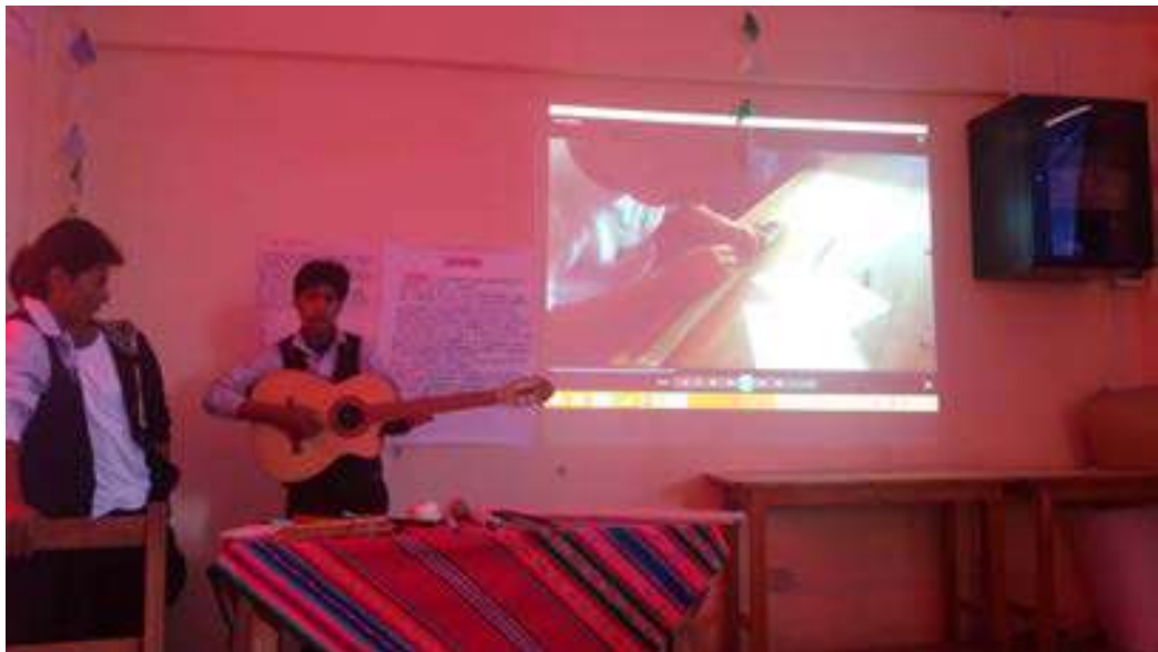
FOTO N° 6: ESTUDIANTE INSPIRANDOSE POESIA ATRAVES DE LAS HORTALIZAS