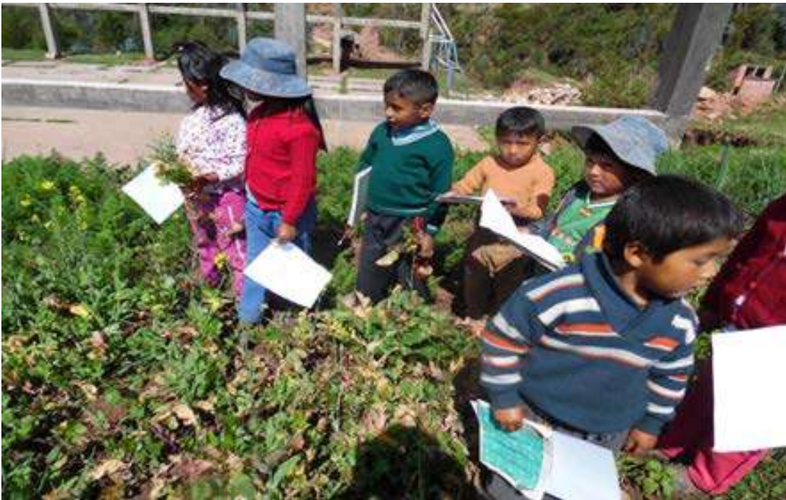
Foto Nro.6: Observamos nuestro Proyecto Socioproductivo con los estudiantes de Segundo de Primaria.