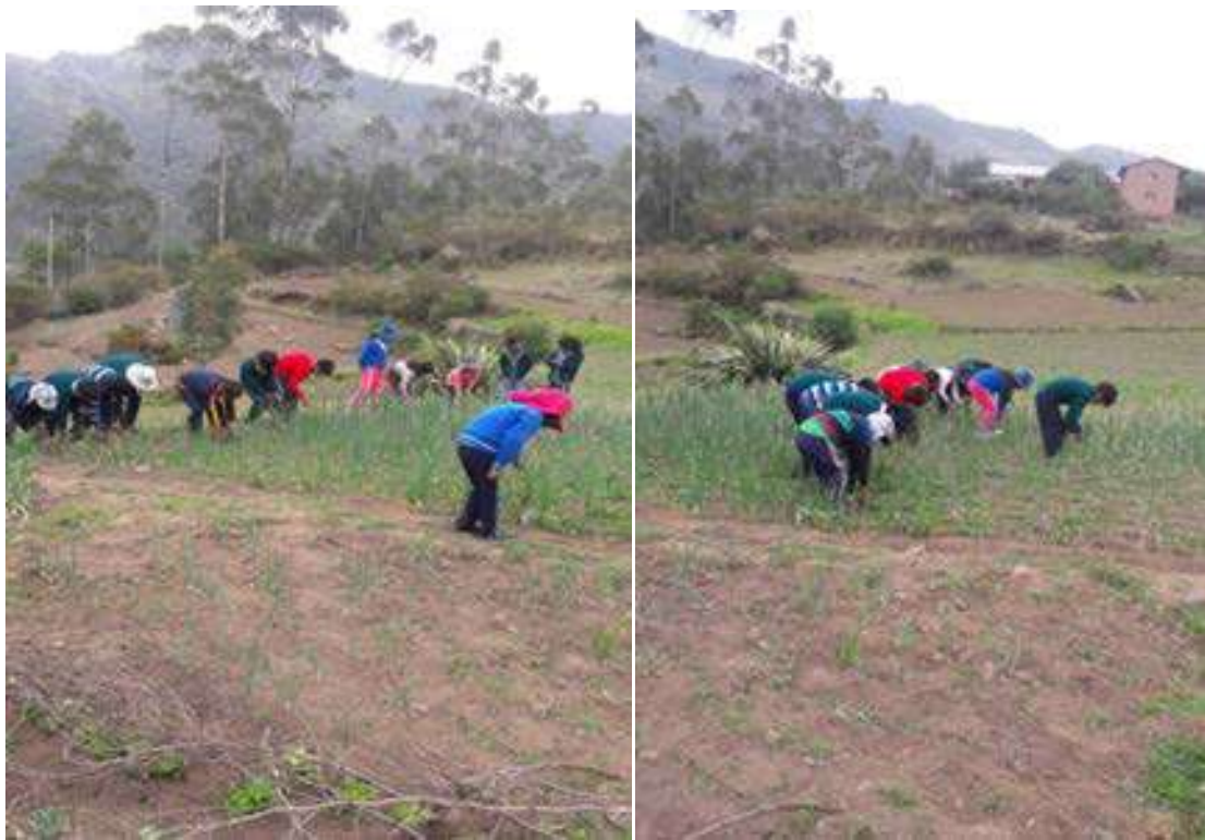
FOTO N° 12: REALIZACION DE LA SUMA CONTANDO EN EL SURCO LAS PLANTITAS DE CEBOLLA