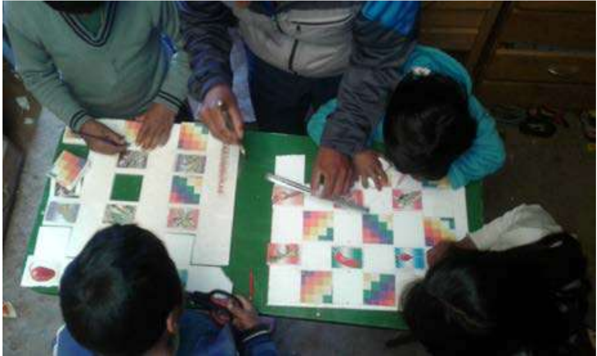
Foto Nro.14: Realizamos nuestros trabajos prácticos con los estudiantes en el aula.