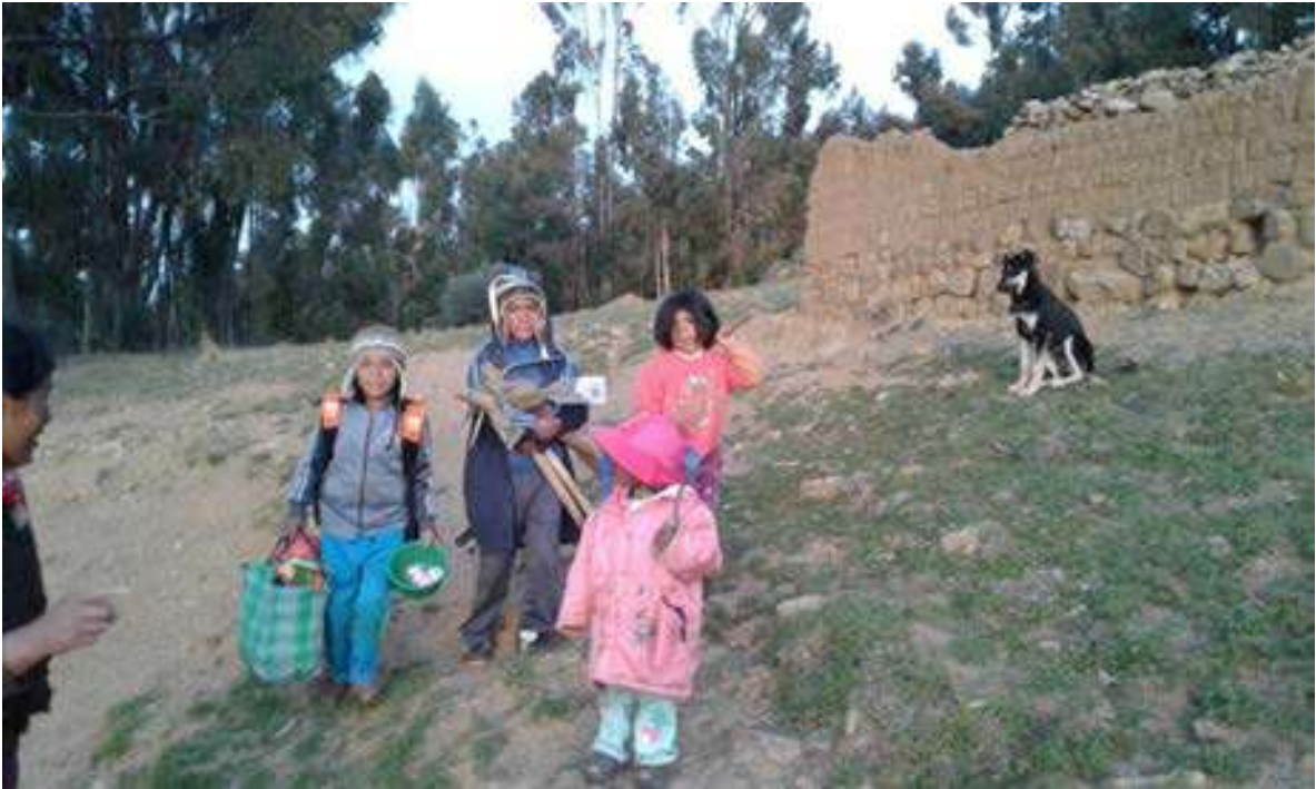
Foto Nro.7: Nos trasladamos con los estudiantes al lugar de nuestro PSP