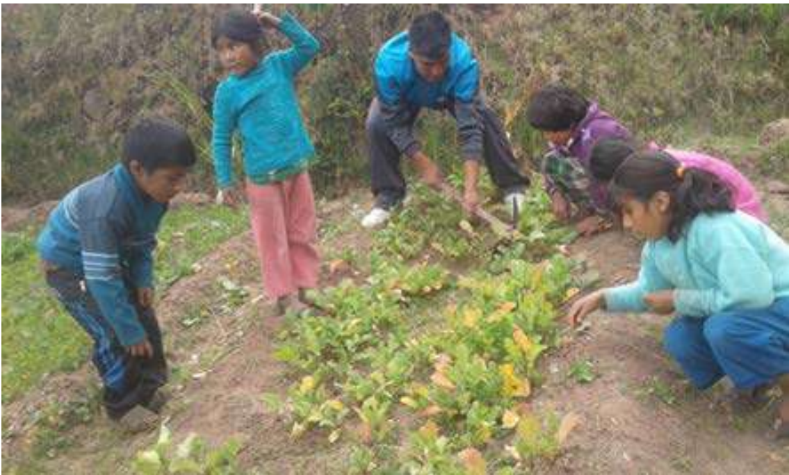
Foto Nro. 10: Realizamos el trabajo de deshierbe con los niños/as