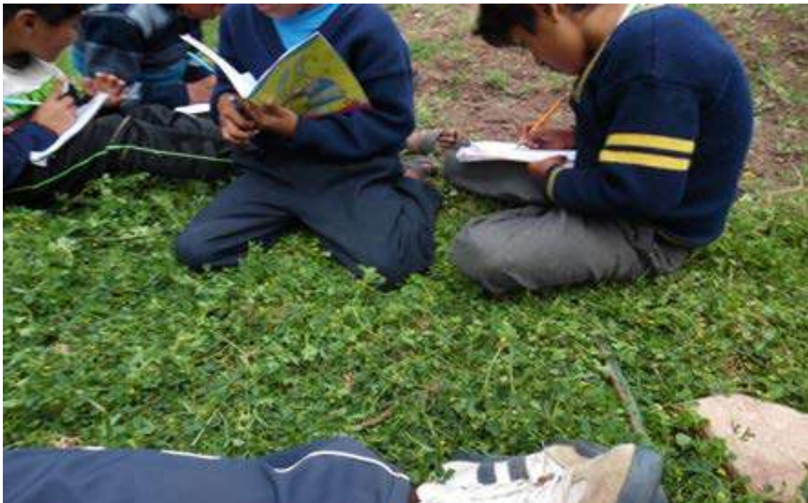
Foto Nro. 4: Realizamos nuestra producción de texto con los niños y niñas .