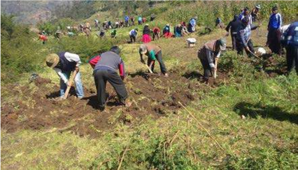
FOTO Nº 1: REALIZACIÓN DEL TRABAJO DEL DESHIERBE Y LIMPIEZA DEL HUERTO ESCOLAR