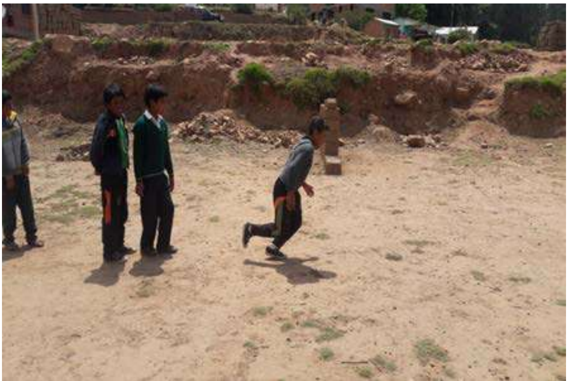
FOTO Nº 10: REALIZACION DE LA CARRERA DE COMPETENCIA EN EL CAMPO DEPORTIVO