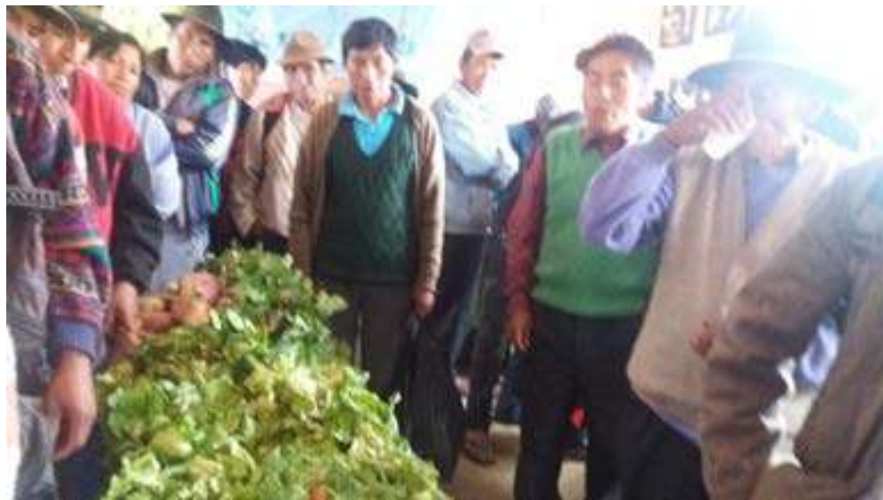
FOTO N° 14: LA COMUNIDAD EDUCATIVA VALORANDO LOS PRODUCTOS DEL PSP