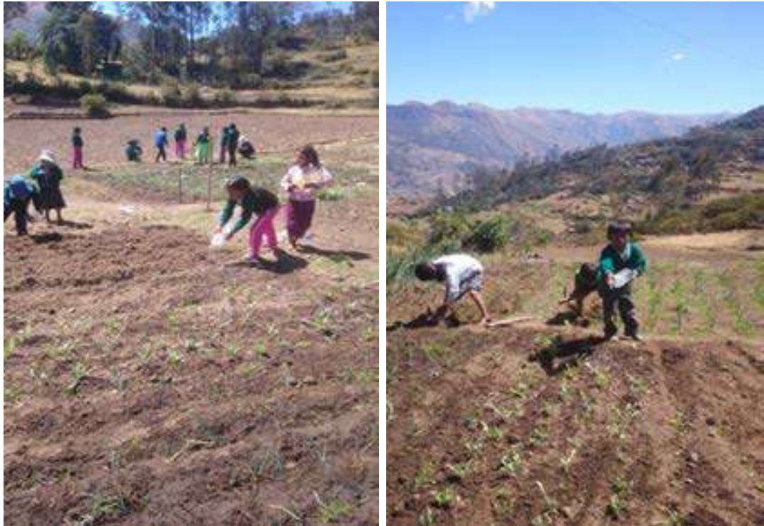
FOTO N° 11: REALIZACION DEL REGADO DE LAS PLANTITAS DEL HUERTO ESCOLAR