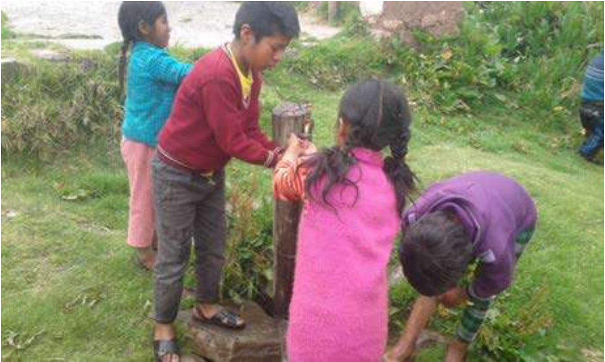
Foto Nro. 11: Después de realizar el trabajo los estudiantes se lavan sus manos , para el retorno al aula.