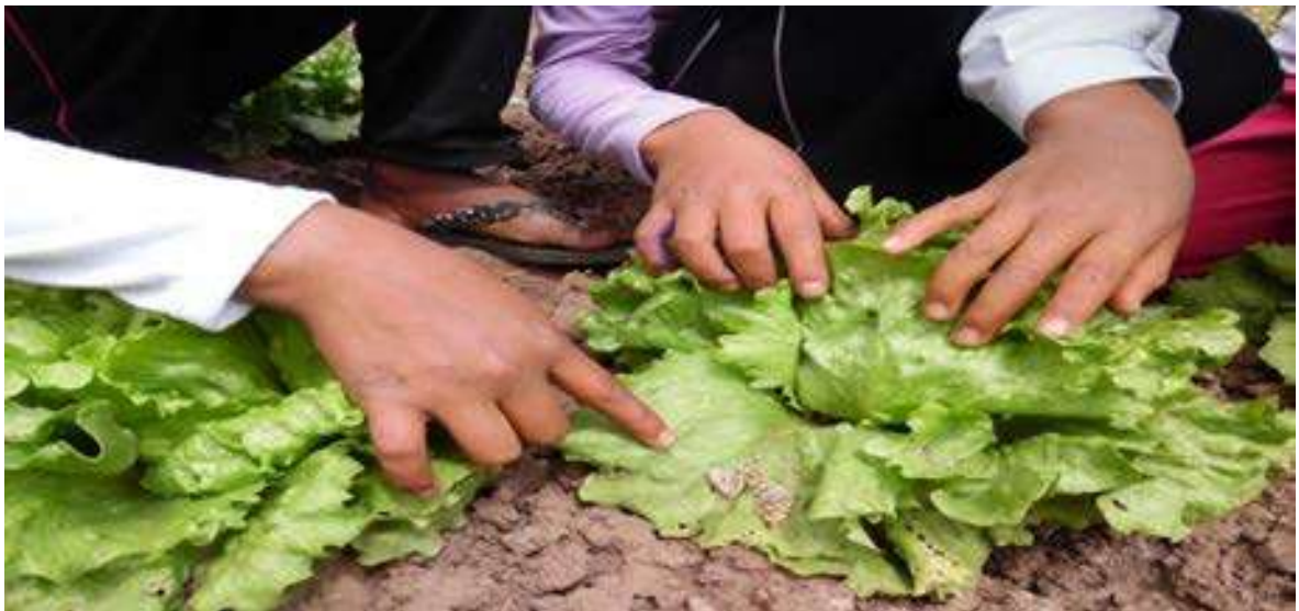
FOTO N° 2: Observamos la mariposa en el PSP. con los niños y niñas