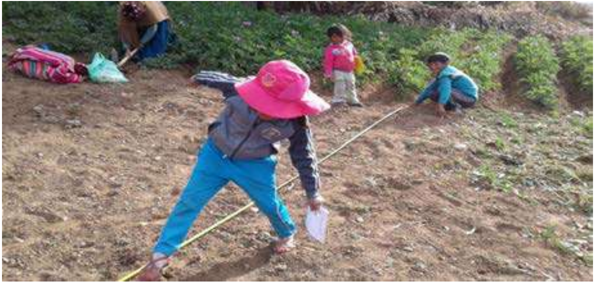
Foto Nro. 3: Realizamos las medidas, para nuestro Socio Productivo en el contexto.