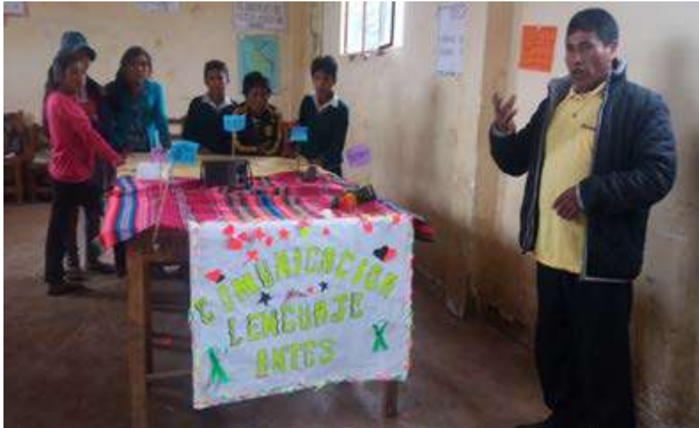
FOTO N° 8: ESTUDIANTES VALORANDO LAS POESIAS ESCRITAS DE LAS HORTALIZAS