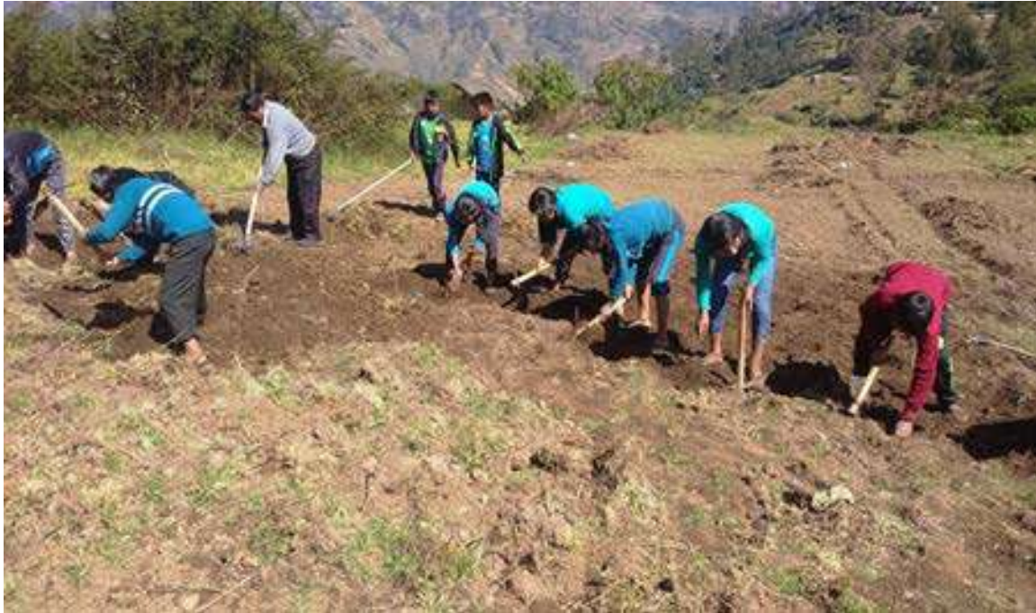
FOTO N° 3: REALIZACION DEL REMOVIDO DE LA TIERRA DEL HUERTO ESCOLAR