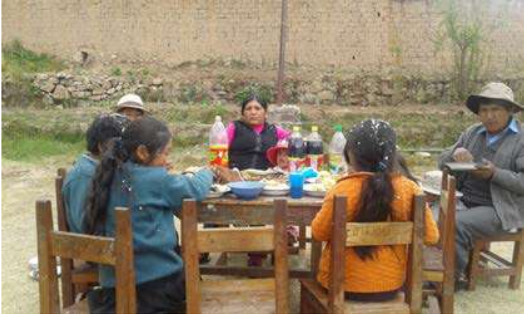
FOTO N° 7 CONVERSANDO CON LOS CONSEJOS EDUCATIVOS Y COMPARTIMIENTO DE APTHAPI