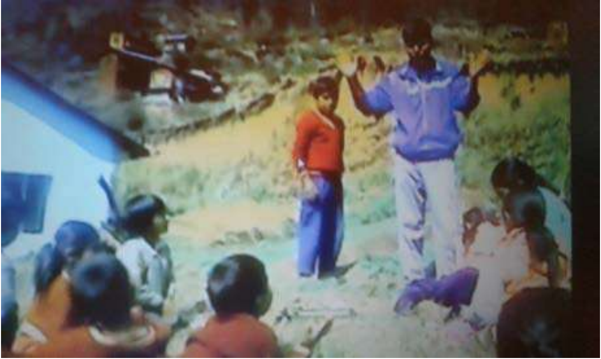
Foto Nro. 5: Dialogamos con los estudiantes sobre el nuestro PSP.