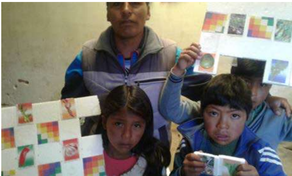
Foto Nro. 15: Exponemos nuestros productos con los niños/as de la Unidad Educativa.