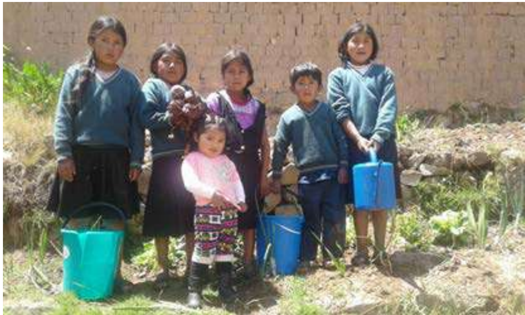
FOTO N° 14 NIÑOS Y NIÑAS TERMINANDO LA GESTION CON EL TRABAJO DE PSP