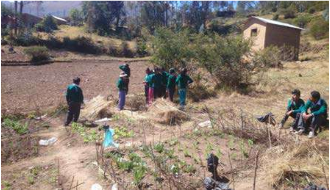
FOTO Nº 9: OBSERVACION DEL HUERTO ESCOLAR POR LOS Y NIÑAS DE LA UNIDAD EDUCATIVA