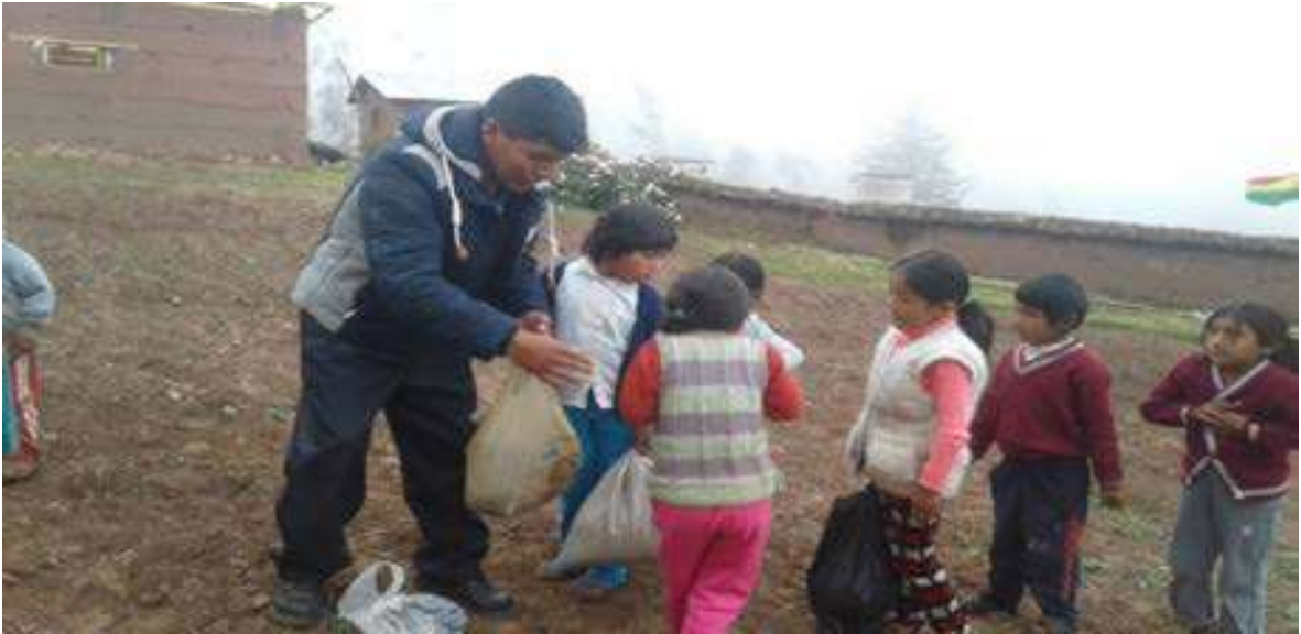
Foto Nro. 9: Recogemos los abonos orgánicos, para la siembra de las hortalizas, de los estudiantes .