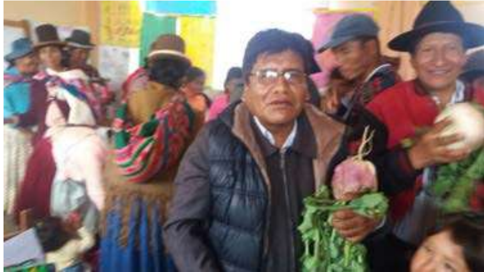
FOTO N° 13: DIRECTOR VALORANDO LA PRODUCCION DE LAS HORTALIZAS EN EL PSP