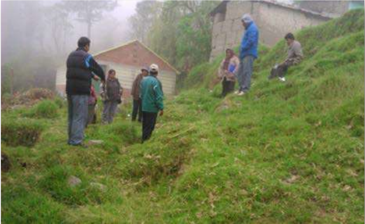
ESTUDIANTE MIDIENDO EL TERRENO DE PSP