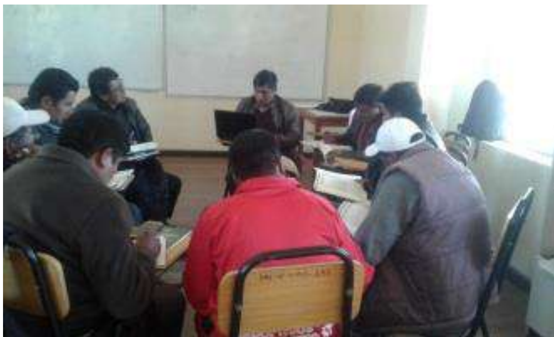
MOMENTOS DE MOTIVACIÓN CON DRAMATIZACIÓN LA ESCUELA ACTUAL Y TRADICIONAL