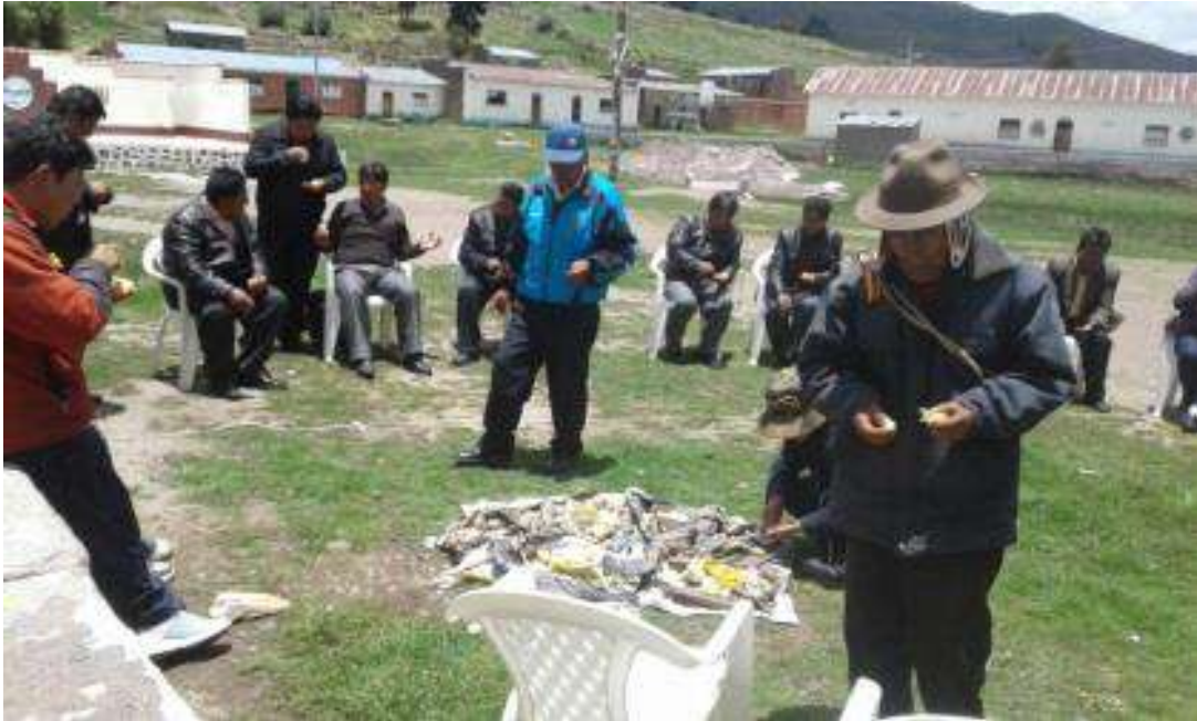
SOCIALIZACIÓN DEL MESCP EN DISTRITOS SORATA