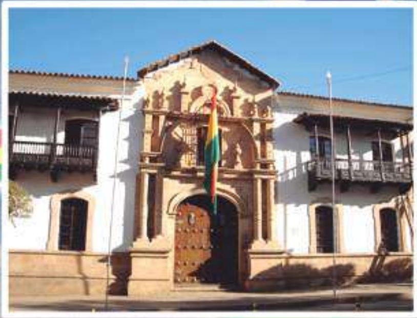
Casa de la Libertad fue el lugar donde se firmó el Acta de la Independencia.