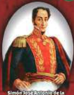
Simón José Antonio de la Santísima Trinidad Bolívar Palacios