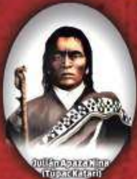
Julián Apaza Nina (Tupac Katari)