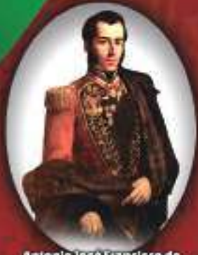
Antonio José Francisco de Sucre y Alcalá