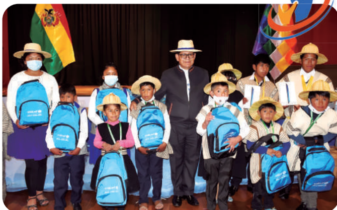
El Gobierno Nacional, a través del Ministerio de Educación, entregó tablets y material escolar a jóvenes, niñas y niños de la nación Uru.