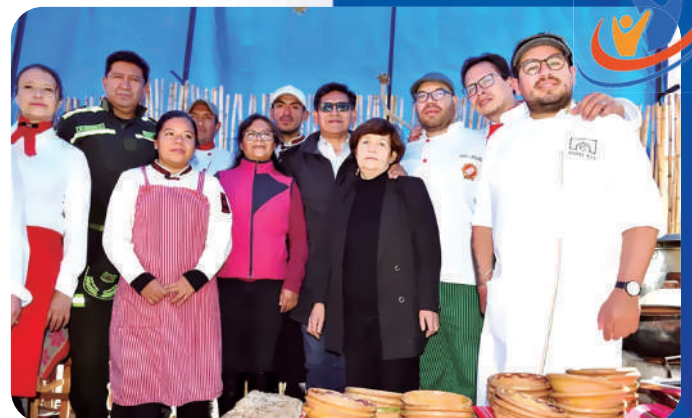
El titular de la cartera de Educación, Edgar Pary, visitó a la comunidad educativa del Instituto Tecnológico Superior Potosí.