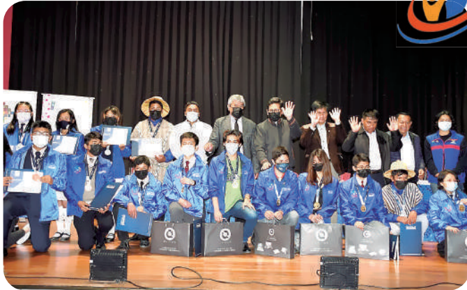
Autoridades del Ministerio de Educación premiaron con laptops y medallas de oro, plata y bronce, a los ganadores de la 10ª Olimpiada Científica Estudiantil Plurinacional.