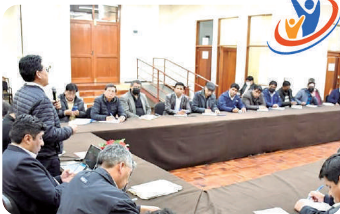
Ministro de Educación, Edgar Pary Chambi, visitó los departamentos de Chuquisaca, Potosí y Beni, donde se reunió con Directores Departamentales y Distritales de Educación.