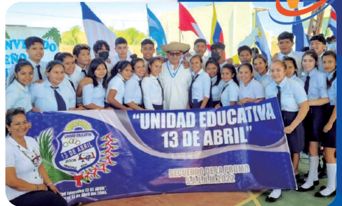
Maestros y estudiantes de la Unidad Educativa "13 de Abril", ubicada en el departamento de Beni, recibieron con cariño la visita del ministro de Educación, Edgar Pary Chambi.