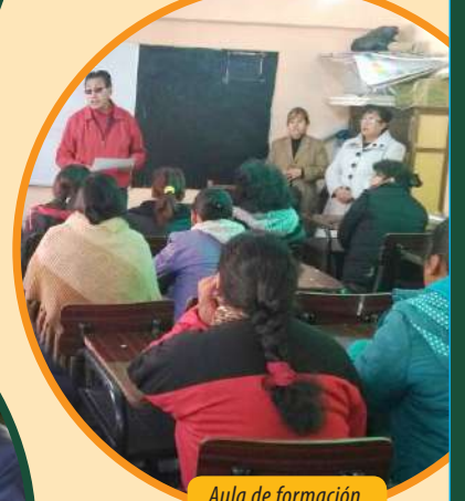
Aula de formación complementaria.