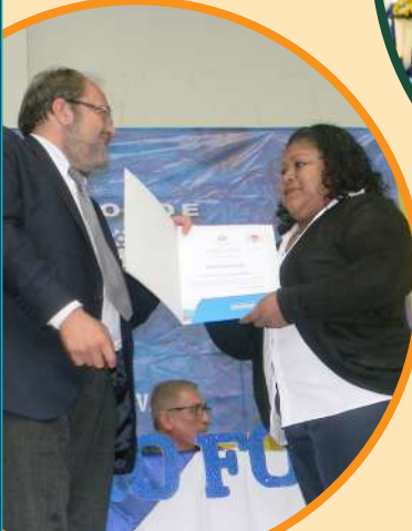
Ministro de Educación en acto de entrega de certificados.