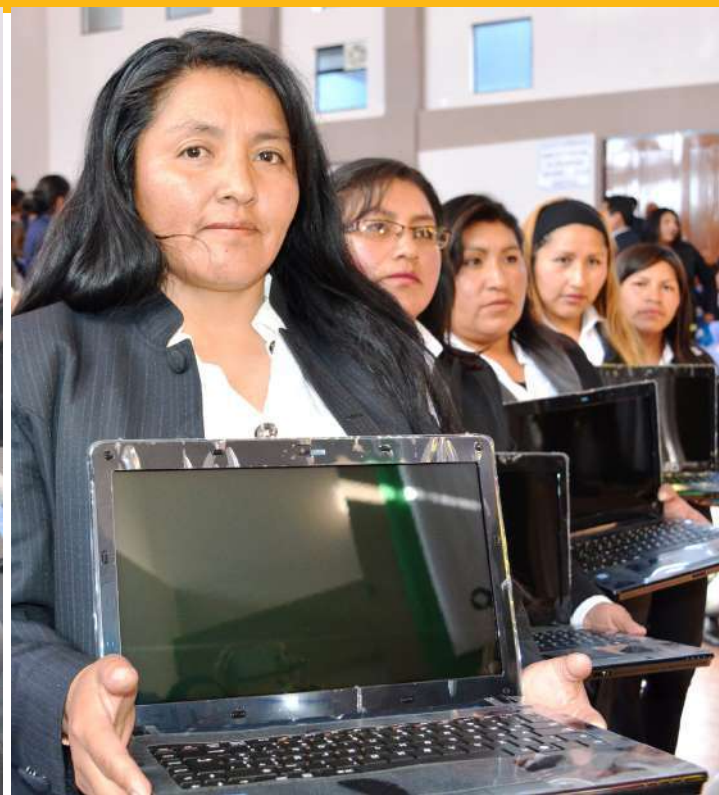
Las secretarías y secretarios de nuestro país ahora son parte del Sistema Educativo Plurinacional y reciben herramientas de trabajo.

El Ministro de Educación, Roberto Aguilar Gómez, durante esta gestión 2017 entregó computadoras personales a las secretarías y secretarios de unidades educativas.