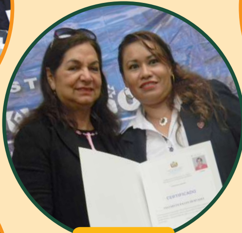
Entrega de certificados en Santa Cruz.