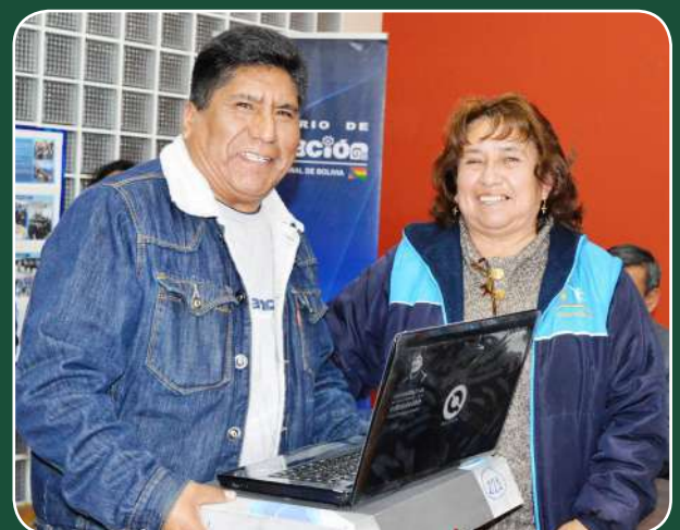
Una herramienta de trabajo permitirá un mejor desempeño

“Veíamos que los maestros y maestras recibían capacitaciones y computadoras, y nosotros no recibíamos nada, pero si nos consideramos una parte fundamental del Sistema Educativo Plurinacional, y gracias a la intervención del Ministerio de Educación que nos visualizó ahora estamos fortalecidas y seremos parte de la construcción del nuevo Modelo