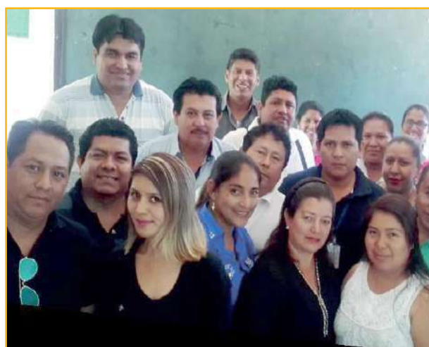
Docentes que participaron del proceso de formación.

En el curso taller de capacitación y actualización en el Modelo Educativo Sociocomunitario Productivo, de 3.869 secretarías y secretarios en ejercicio registrados en planillas del SEP, equivalentes al 100%, 2.764 participantes equivalentes a 71% concluyen el curso taller y 1.105 participantes, equivalentes al 29%, no se presentaron al curso taller.