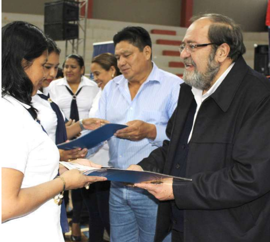
Ministro de Educación entregó certificados del curso de actualización a secretarías y secretarios del departamento del Beni

Ministerio de Educación Unidad de Comunicación Av. Arce No. 2147 - La Paz, Bolivia