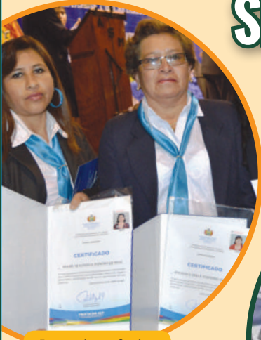
Entrega de certificados en Cochabamba.