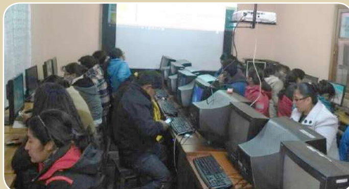
La práctica acompañó la formación de secretarías y secretarios.