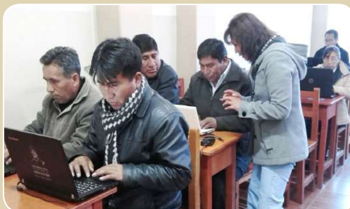
En la ciudad de El Alto secretarías y secretarios participan del curso.