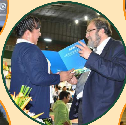
Formación y capacitación certificada.