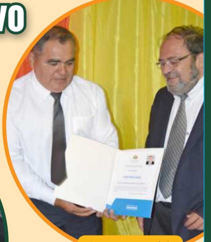
Los secretarios también recibieron su certificación