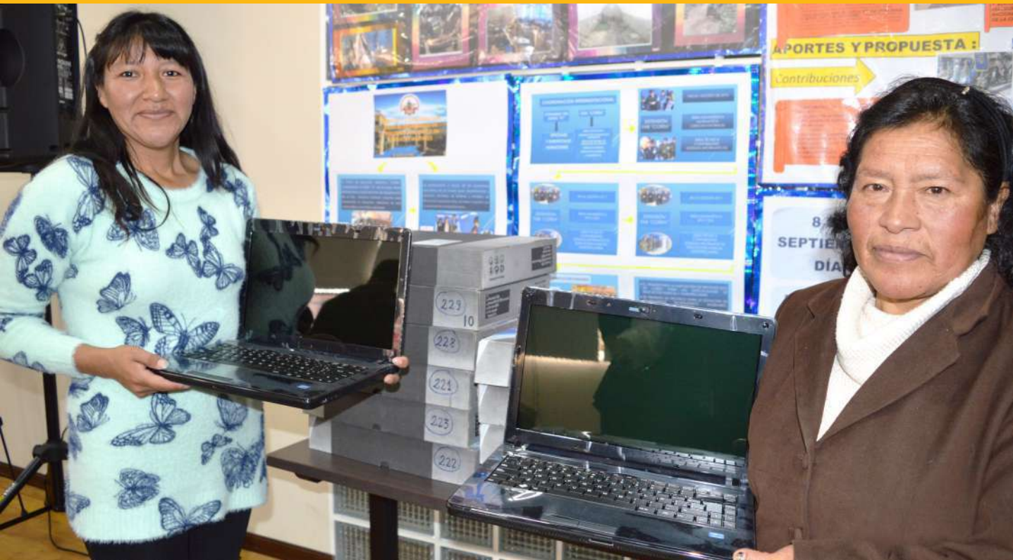
Secretarías de Educación Especial también recibieron sus computadoras.

Educativo, las secretarías y secretarios tenemos muchas potencialidades”, sostuvo.