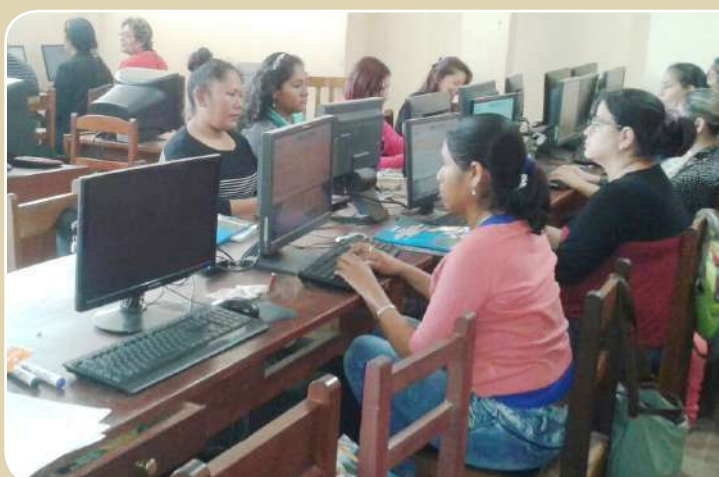
Yapacaní participó activamente de la formación complementaria.

La facilitación de cada módulo y las unidades temáticas están a cargo de docentes de especialidad de cada Instituto, quienes en esta primera versión realizan el avance respectivo de manera comprometida ad honorem. A la fecha son 72 docentes en cada uno de los institutos, son parte del presente curso a quienes al finalizar el ciclo formativo, se les hará un reconocimiento certificado por su labor.