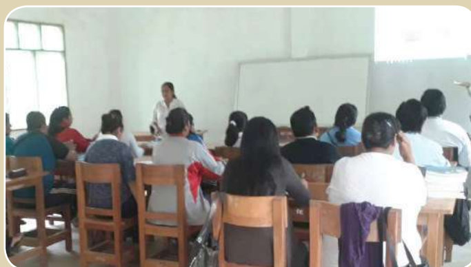
Secretarías y secretarios de Caranavi se unieron al proceso.

Las y los participantes del Curso de Formación Complementaria en Secretariado Ejecutivo en Educación, de acuerdo a calendario académico y el Plan de Estudios en sistema modular, desarrollan sus actividades académicas los días sábados y domingos en los diferentes Institutos Técnicos o Tecnológicos designados previamente.