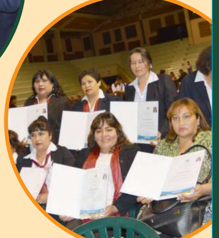
Entrega de certificados a secretarias en Cochabamba.