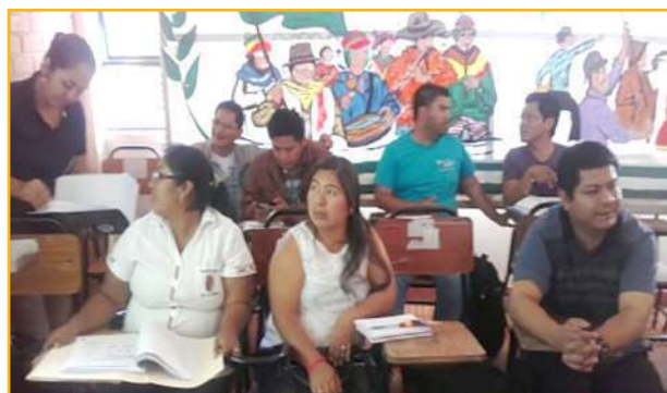
Curso taller para secretarías y secretarios

Estos talleres se realizaron en un 1er. Momento por las facilitadoras/es del PROFOCOM – SEP; el 2do. momento fue con la participación de Docentes de Institutos Técnicos, área de Redacción, Comunicación y Lenguaje; para el 3er. momento se invitó a técnicos de las Direcciones Departamentales y Direcciones Distritales que tienen conocimiento y manejo del SIE (Sistema Informático de Educación); y para el 4to. taller se invitó a Técnicos de Recursos Humanos de las Direcciones Departamentales y Direcciones Distritales de Educación los mismos que tienen conocimiento en el tema de planillas.