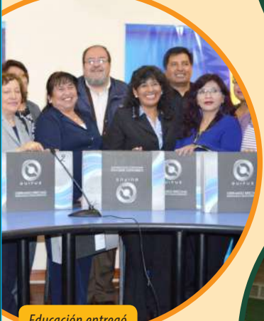
Educación entregó computadoras.