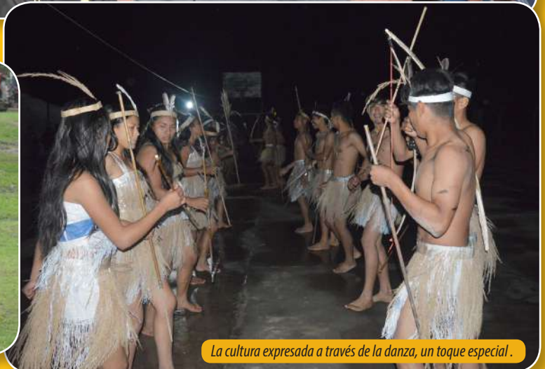
La cultura expresada a través de la danza, un toque especial.