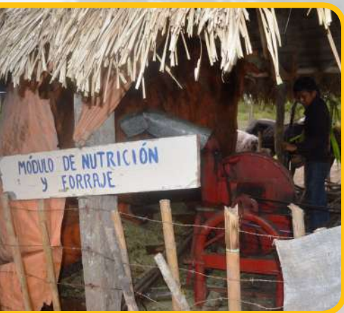
Estudiante realiza su práctica en el módulo de forraje.