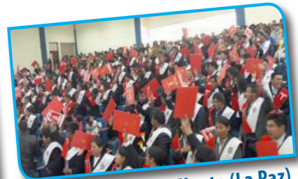
ESFM Santiago de Huata (La Paz)