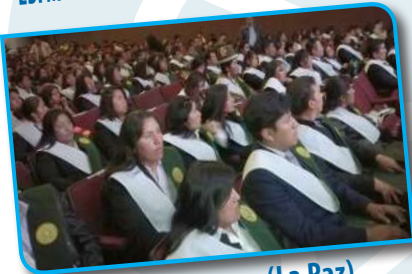
ESFM Calahumana (La Paz)