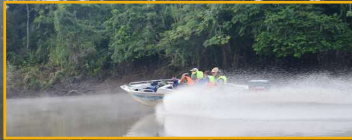
La experiencia es única cuando se atraviesa por los ríos de la Amazonía boliviana.

El clima es cálido y húmedo, atravesar los ríos Isiboro, Ibare y Madre de Dios son la guía perfecta para conocer las pinturas innatas de la naturaleza, mientras las aguas de los afluentes salpican haciéndose denotar que a sus orillas habitan especies de mamíferos, reptiles y aves que te esperan para mostrar su belleza.