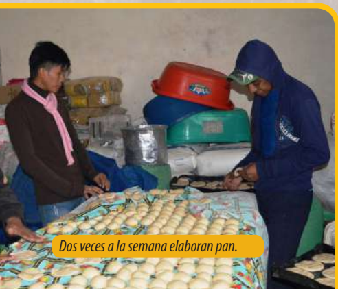
Dos veces a la semana elaboran pan.