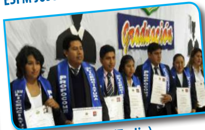
U.A. Gran Chaco (Tarija)