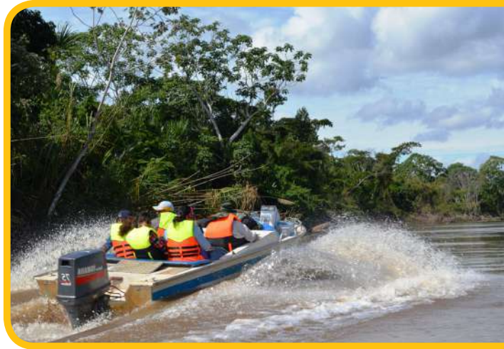
Once horas navegando permitieron la llegada del Ministro de Educación.

Resaltó el esfuerzo de los estudiantes que a través de su formación teórica y práctica se constituyen en un ejemplo para las futuras generaciones. “Serán nuestro modelo y estamos seguros de que podemos cambiar la vida de otros jóvenes y señoritas que quieren cambiar su futuro y seguir estudiando”.