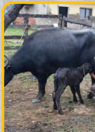
Módulo de lech...