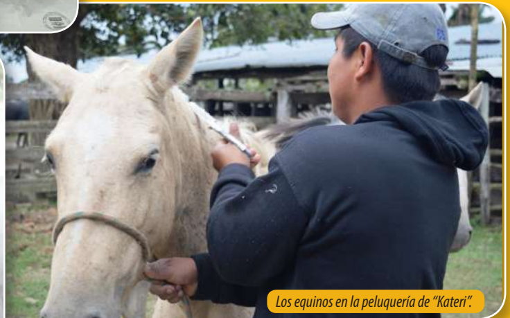
Los equinos en la peluquería de "Kateri".