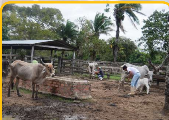
Módulo de bovinos.