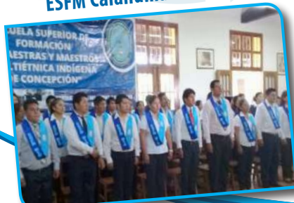
ESFM Multiétnica Concepción (Santa Cruz)