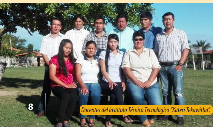
Docentes del Instituto Técnico Tecnológico “Kateri Tekawitha”.

“El Ministerio de Educación realizó un cambio de impacto en la educación, permitiendo su derecho a la educación de todos los bolivianos, incluso a las comunidades más alejadas”.