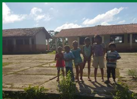
La educación llega a la Amazonía.