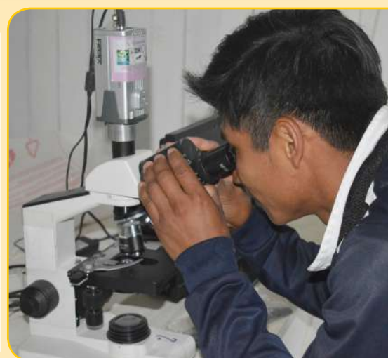
Laboratorio de práctica de sanidad animal en el TIPNIS.