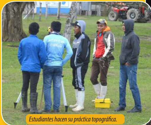
Estudiantes hacen su práctica topográfica.