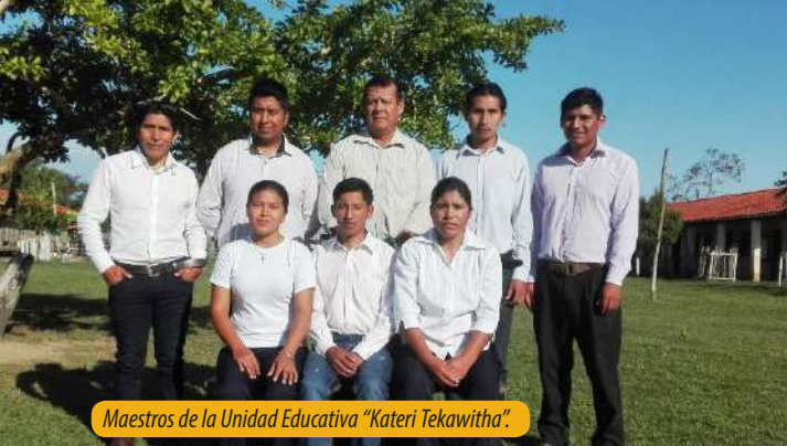
Maestros de la Unidad Educativa “Kateri Tekawitha”.