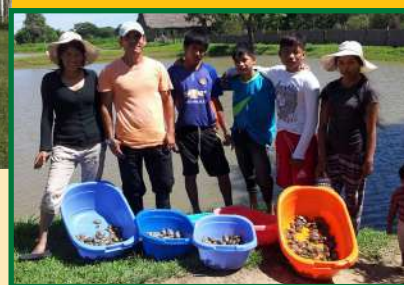
Práctica de repoblamiento de tortugas de los ríos del Amazonas.