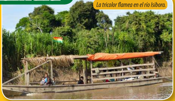
La tricolor flamea en el río Isiboro.