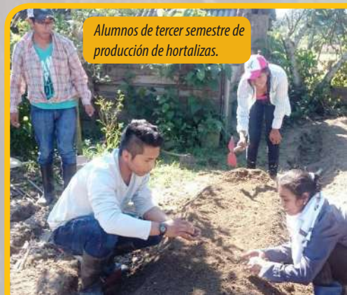
Alumnos de tercer semestre de producción de hortalizas.