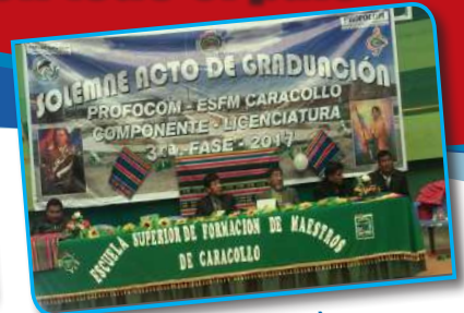
ESFM Caracollo (Oruro)