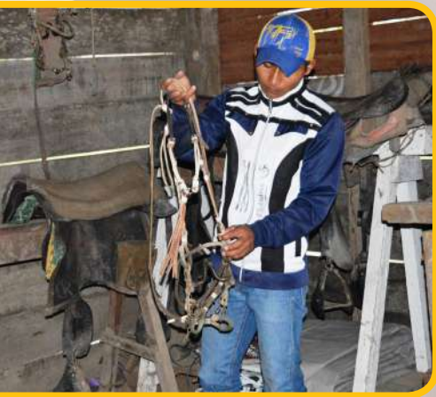
Área de equipamiento.