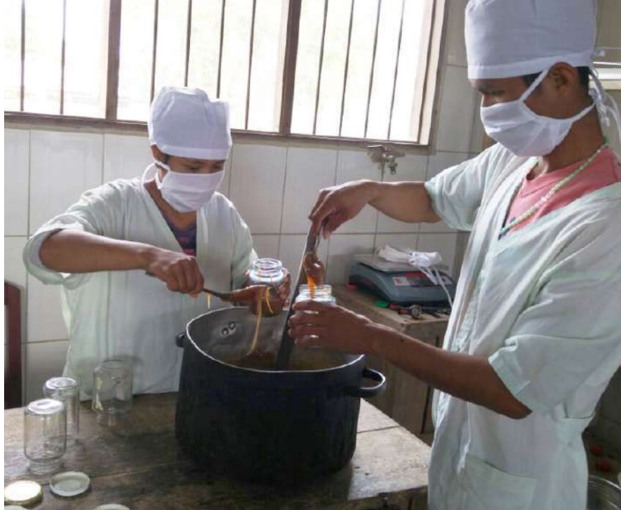
El área de producción del Instituto KATERI TEKAWITHA refleja los conocimientos adquiridos.

Ministerio de Educación Unidad de Comunicación Av. Arce No. 2147 - La Paz, Bolivia