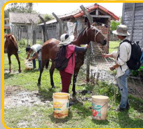
Estudiantes del módulo de equinos