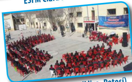
ESFM José D. Berrios (Llica, Potosí)

Actos de titulación 3 ra FASE: 10.500 maestras y maestros titulados