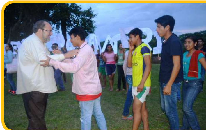
Estudiantes del Kateri recibieron a la autoridad.