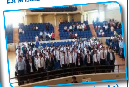
U.A. Villa Tunari (Cochabamba)