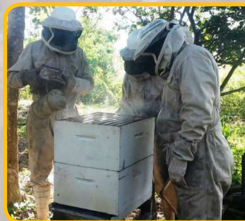
Práctica diaria del módulo de apicultura.