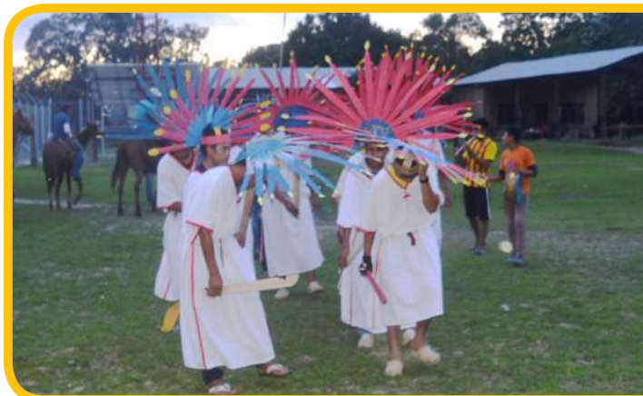
La danza de los Macheteros y la Tamborita fueron parte de la recepción.