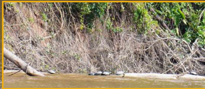
La diversidad de la fauna se refleja a la luz del sol.