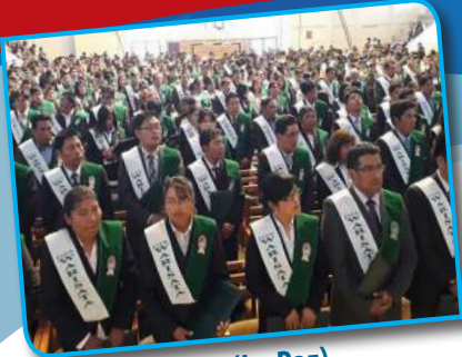
ESFM Warisata (La Paz)