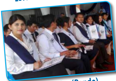
ESFM Puerto Rico (Pando)