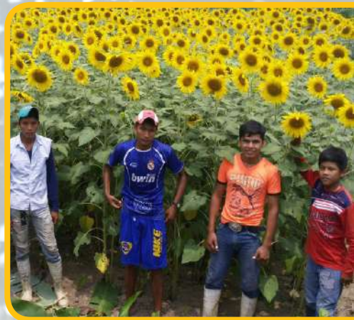
Estudiantes muestran la producción que se logró en el área de agricultura

Ambas instancias educativas cuentan con el nivel secundario y formación técnica superior, preparando a estudiantes de la región que se dedican a la porcicultura, avicultura, apicultura, manejo de ganado tanto de carne como lechero, productos lácteos, sanidad animal, agroforestal, cultivos anuales, horticultura y fruticultura, entre otros.