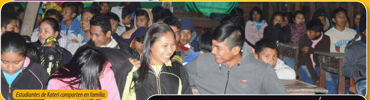
Estudiantes de Kateri comparten en familia.