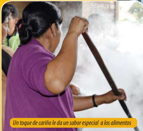
Un toque de cariño le da un sabor especial a los alimentos