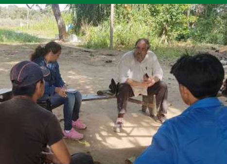
U.E. San Antonio de Loras

La Unidad Educativa "San Antonio de Loras" se encuentra ubicada en el distrito educativo Loreto, de la comunidad San Antonio de Loras. En tanto que la Unidad Educativa "Remanso" se encuentra ubicada en el distrito educativo San Andrés de la comunidad Villa Carmen del Remanso.