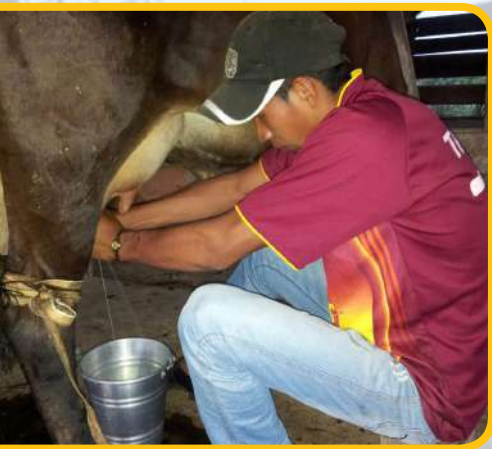
Módulo de producción lechera de búfalo.