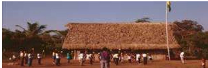
Primera escuela seccional de pueblo Chacobo en la comunidad Alto Ivon en los años 1980 con el bilingüe de la misma comunidad

Se muestra fotografía de las unidades educativas tanto central como seccional: