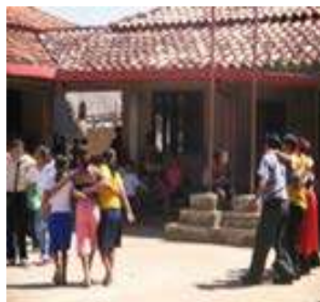
Colegio Alto Ivon