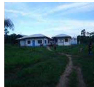
Escuela siete almendro